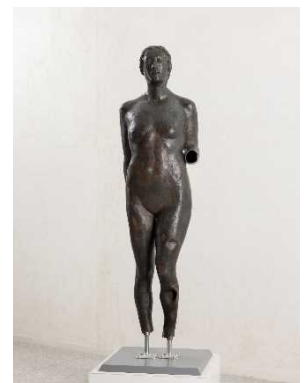
柳原義達《岩頭の女》 陸前高田市教育委員会蔵