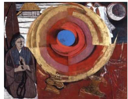
荘司福《祈》宮城県美術館蔵