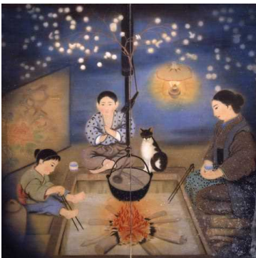
酒井三良《雪に埋もれつつ正月はゆく》 福島県立美術館蔵