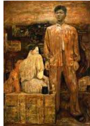
松本竣介《画家の像》宮城県美術館蔵