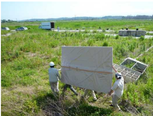
福島県浪江町でのレスキュー作業