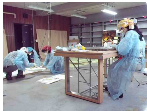
レスキュー作品の応急処置作業