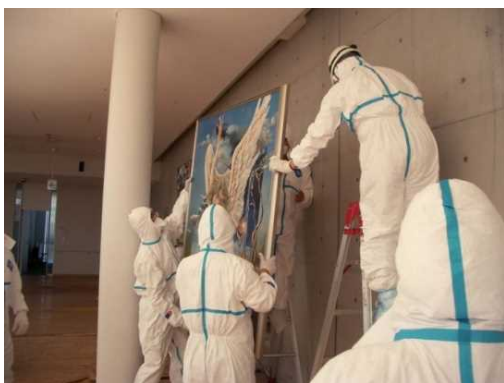
福島県富岡町でのレスキュー作業

岩手、宮城、福島を代表する美術作品を通して東北の美術の魅力を紹介するとともに、東日本大震災を受けて復興途上にある被災地の美術館や博物館の状況と文化財レスキューをはじめとする救援活動、そして現状の課題を報告します。