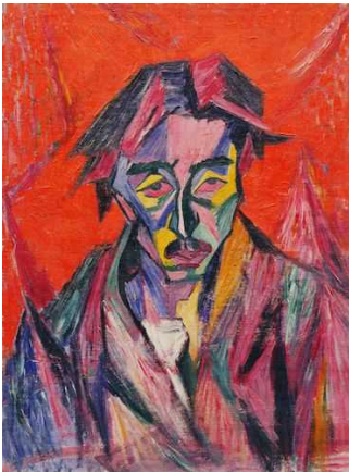
萬鐵五郎《赤い目の自画像》岩手県立美術館蔵