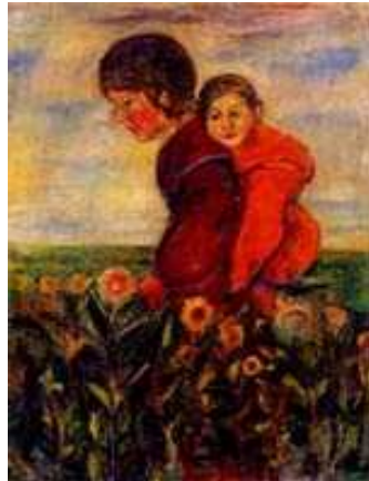
関根正二《姉弟》福島県立美術館蔵