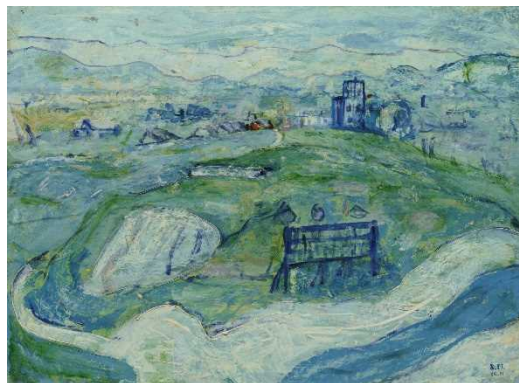
松本竣介《盛岡風景》岩手県立美術館蔵