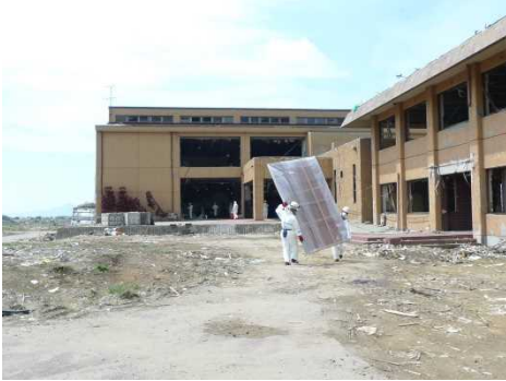
陸前高田市博物館でのレスキュー作業

【展示予定作品】 14 作家 約 30 点 この他にレスキュー活動記録写真など約 40 点